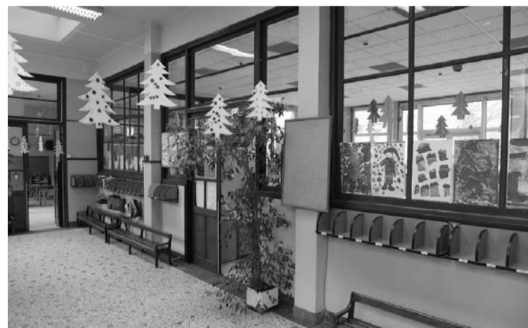
Les jardins d’enfants sont en fait des locaux pour les jeunes.

Le mécontentement est profond contre cette ville de Paris, commune la plus riche du pays, qui cherche à faire des économies budgétaires sur ces structures « à part » des quartiers populaires. C’est d’autant plus révoltant que la disparition des 1 236 places