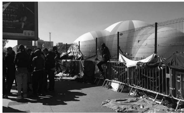
Le camp de migrants de la porte de la Chapelle.

dizaines de milliers de réfugiés. Il a flatté les préjugés racistes en les pourchassant et en présentant leur accueil comme un problème dans un pays riche de 65 millions d'habitants. Cela a favorisé la montée du FN, mais ne peut empêcher ces hommes et ces femmes de chercher à tout prix une solution, quitte à subir des conditions de vie indignes et les outrages et