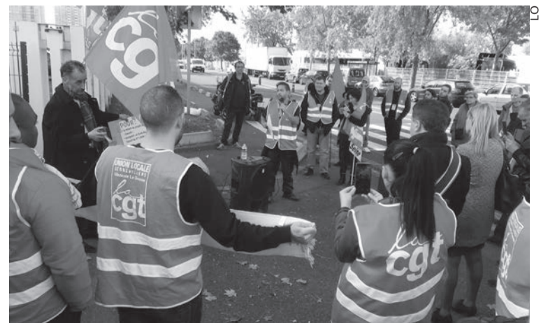
Le rassemblement du 4 octobre devant Calberson.