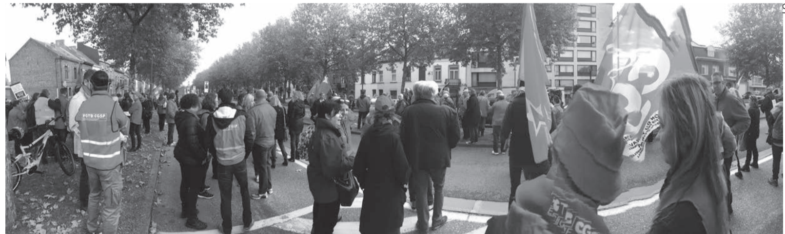
Rassemblement à Mons (Belgique) le 10 octobre 2017.

La SNCB est particulièrement touchée par une réduction de budget de 1,2 à 3 milliards d'euros. Le