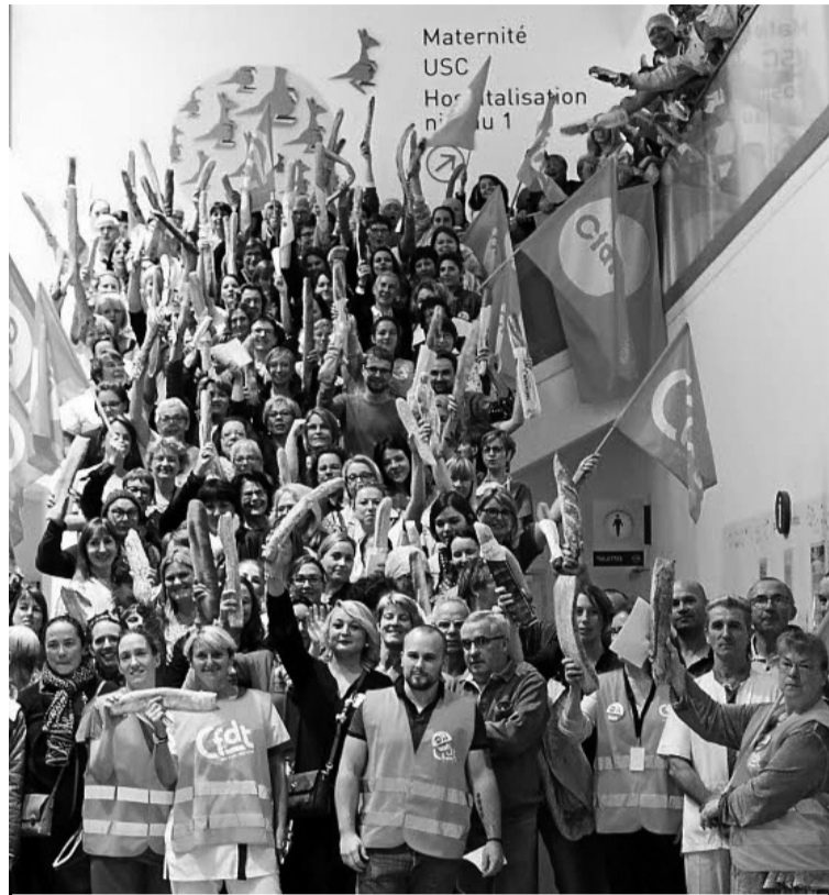
Les salariés de l'hôpital brandissant des baguettes.

Mardi 3 octobre, plus de la moitié du personnel du nouvel hôpital de Plérin, près de Saint-Brieuc, a débrayé pour protester contre l'augmentation de salaire ridicule proposée par la direction de l'établissement.