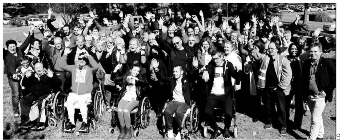
Le pique-nique du comité de défense des patients.