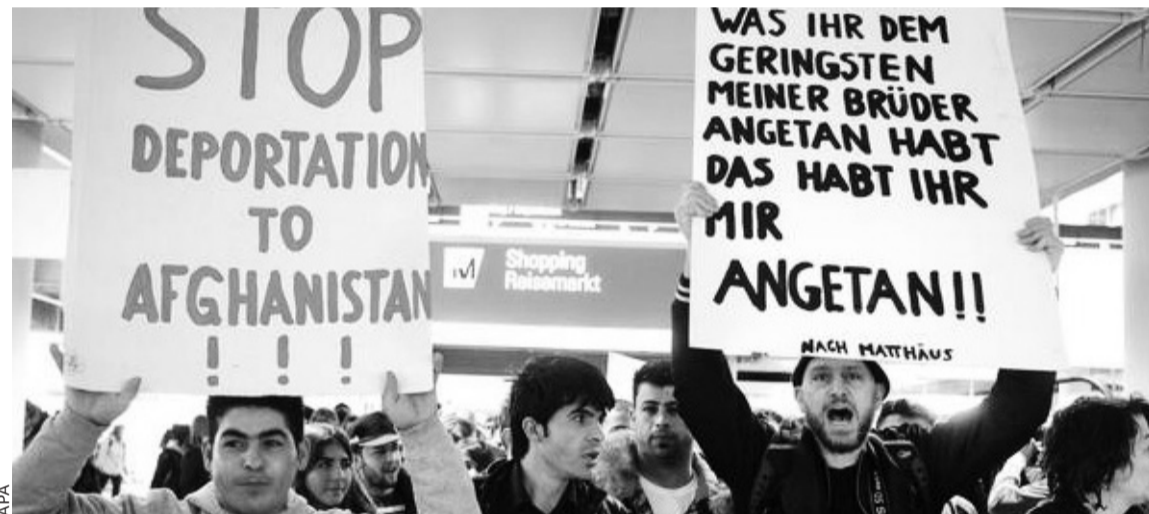
Manifester contre l'expulsion des Afghans à l'aéroport de Munich.