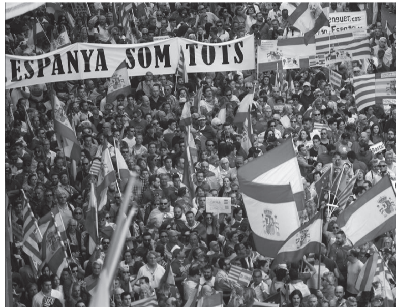
Espagnol ou catalan, le nationalisme est étranger au mouvement ouvrier.

(...) C'est un plan d'un nationalisme raffiné qui corrompt