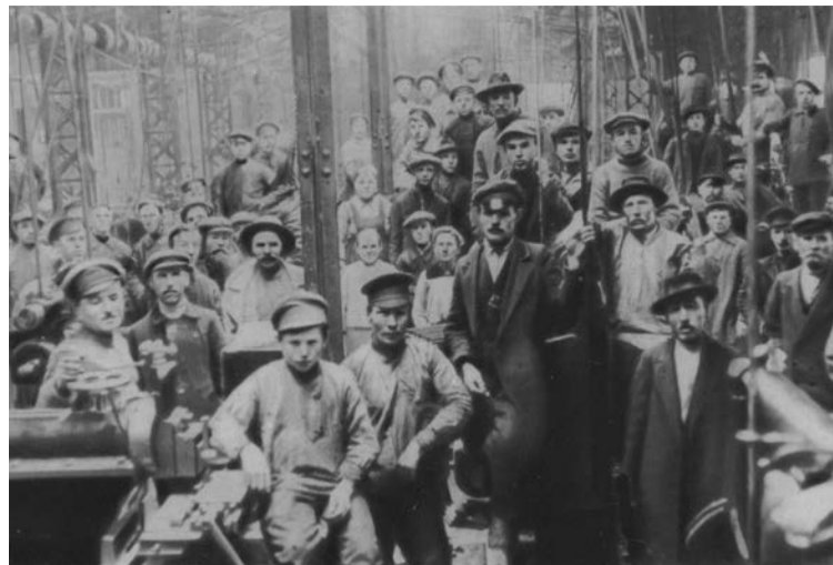
Des ouvriers mobilisés dans une usine.

Lénine pressa alors le Parti bolchevique de déclencher l'insurrection sans attendre le congrès et écrivit: « La révolution est perdue si le gouvernement de Kerenski n'est pas renversé par les prolétaires et les soldats très prochainement... Il faut mobiliser toutes les forces pour inculquer aux ouvriers et aux soldats l'idée de l'absolue nécessité d'une lutte