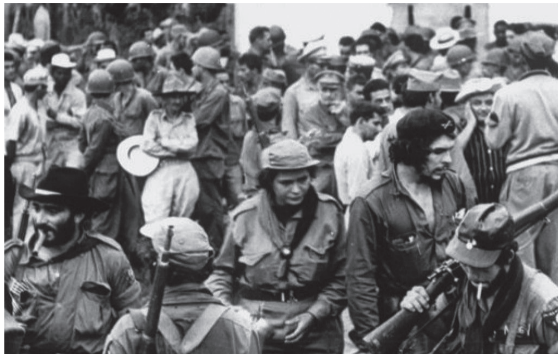
Che Guevara en compagnie de guerilleros lors de la prise du pouvoir en 1959.

cubain, directeur de la Banque nationale, puis ministre de l'Industrie, sa volonté de poursuivre le combat contre l'impérialisme, sans se limiter à Cuba, lui fit reprendre le chemin de la lutte armée. Après une vaine tentative au Congo en 1965, c'est en Bolivie qu'il tenta de créer ce qu'il