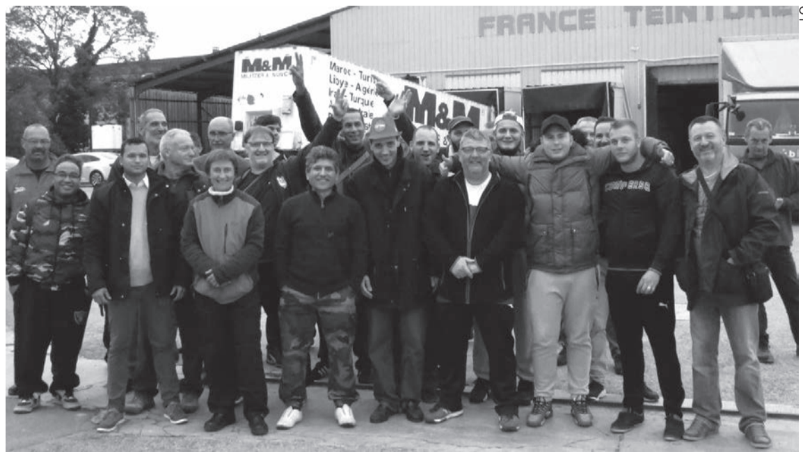
Les grévistes de France Teinture le 2 octobre.