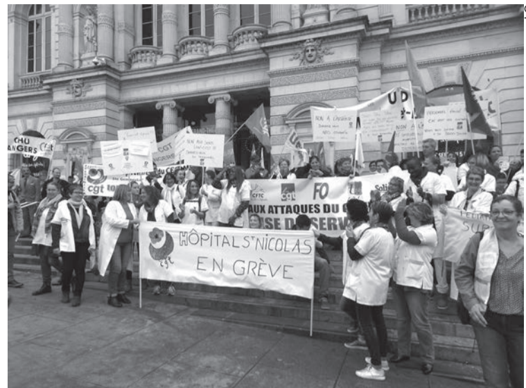
Des travailleurs de la santé à Angers, le 10 octobre.

Macron et ses ministres utilisent les mêmes