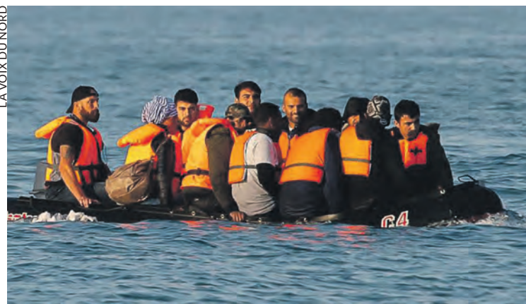
LA VOIX DU NORD