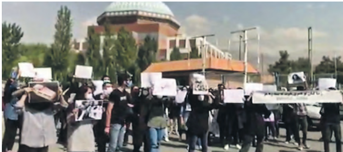
Manifestation d'étudiants, le 19 septembre.

Face aux manifestants, la police est intervenue, arrêtant plusieurs d'entre eux et dispersant la foule à l'aide de matraques et de gaz lacrymogène. Selon le Haut-Commissariat de l'ONU aux Droits de l'homme, la police aurait tiré à balles réelles dans plusieurs villes du pays, tuant au moins six