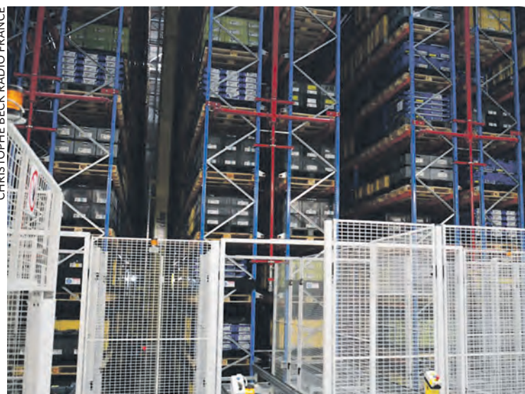
CHRISTOPHE BECK RADIO FRANCE