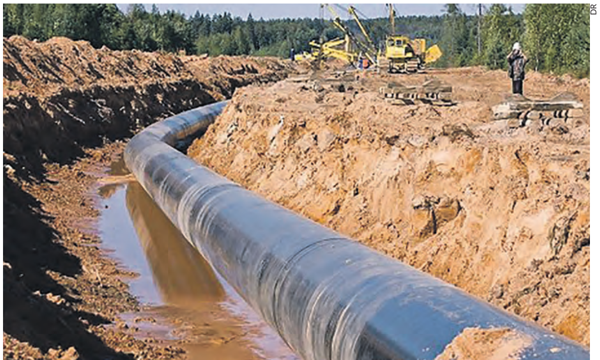
Travaux de construction du pipeline de TotalEnergies entre l'Ouganda et la Tanzanie.