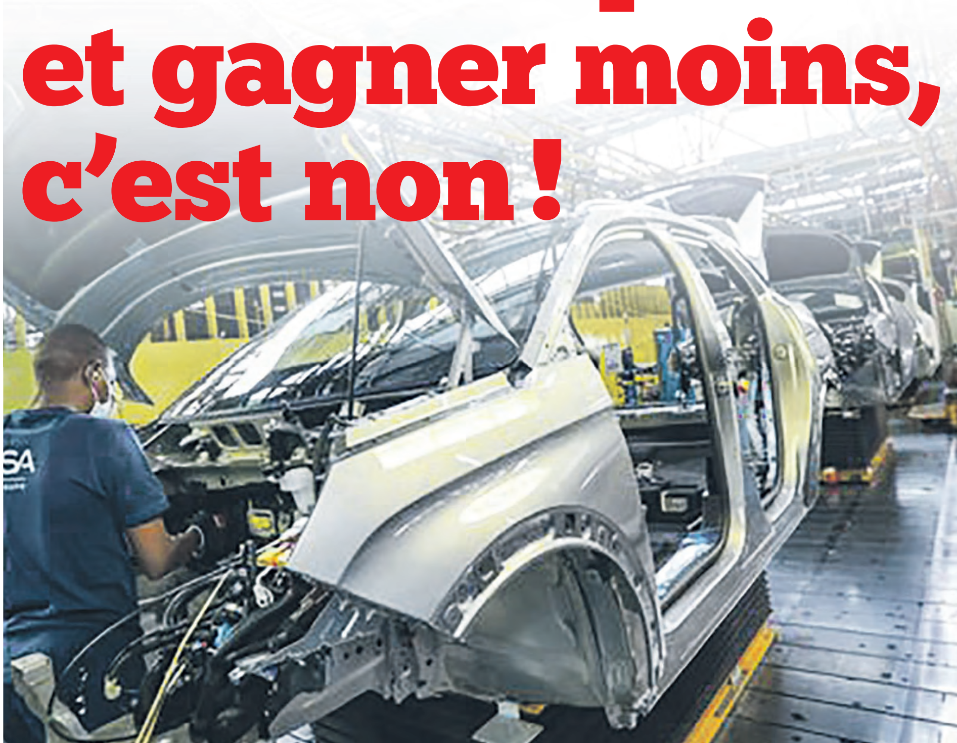
LIONEL VADAM MAXPPP