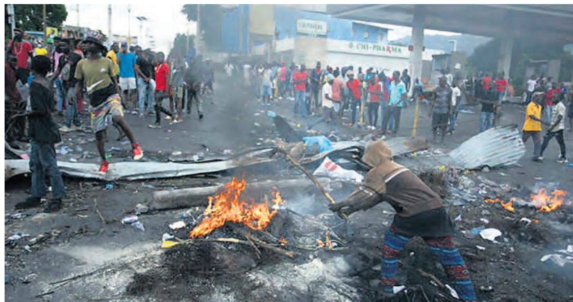
Manifestation en Haïti pour protester contre la hausse des prix de l'essence.