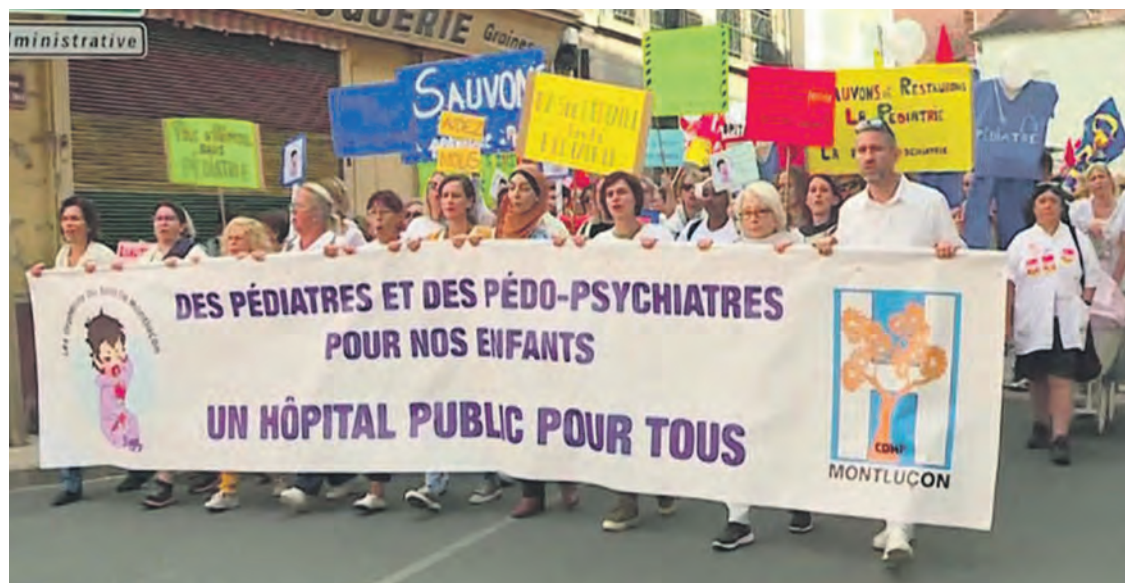
Manifestation du 15 septembre à Montluçon.