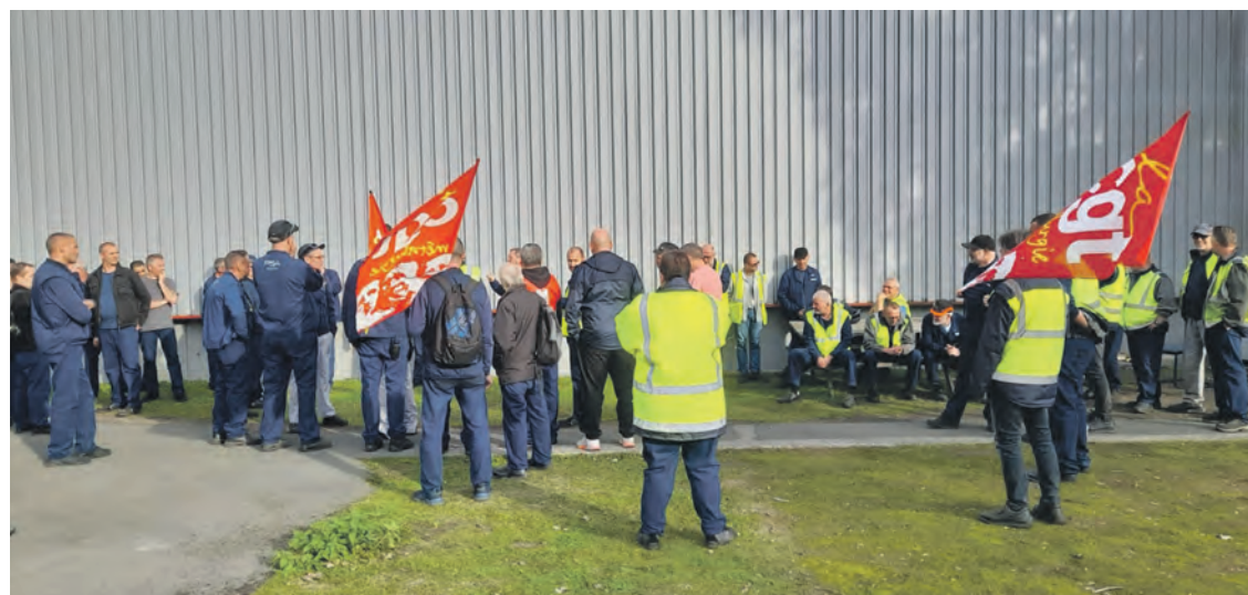
Ouvriers en grève à PSA Stellantis Hordain

La direction a tout refusé, comptant sur le fait que la grève n'allait pas passer le week-end. Mais l'équipe du samedi matin a continué