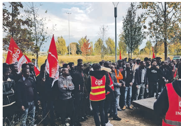
Sans-papiers en lutte à Samsic, Rungis, le 19 octobre 2023.

Les travailleurs sans papiers n'en peuvent plus de subir les salaires de misère,