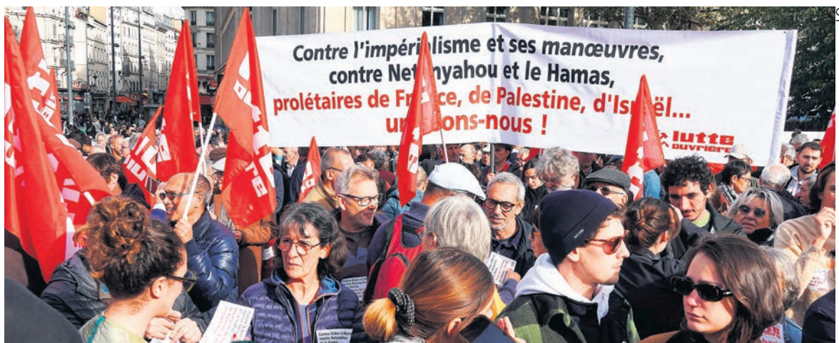
Le 22 octobre à Paris.