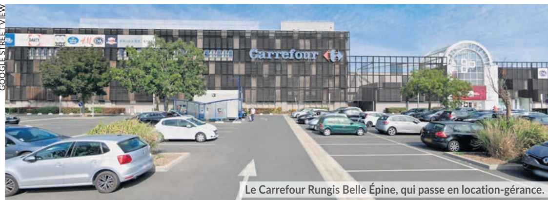
Le Carrefour Rungis Belle Épine, qui passe en location-gérance.

Le groupe Carrefour vient d'annoncer le passage en location-gérance de 37 nouveaux magasins, 16 hypers et 21 supermarchés. Cela concerne près de 4 000 travailleurs, que le patron voudrait sortir des effectifs, à la suite de 23 000 autres depuis 2018.