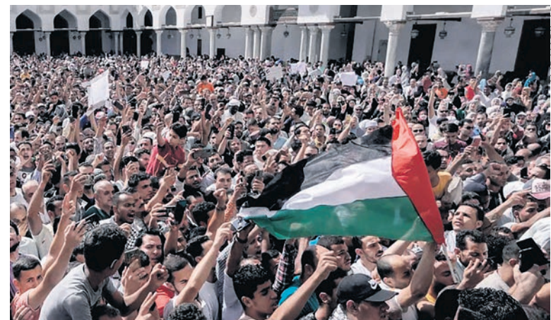
Manifestation en solidarité avec les Gazaouis au Caire le 20 octobre.

Biden et son état-major savent parfaitement que leur