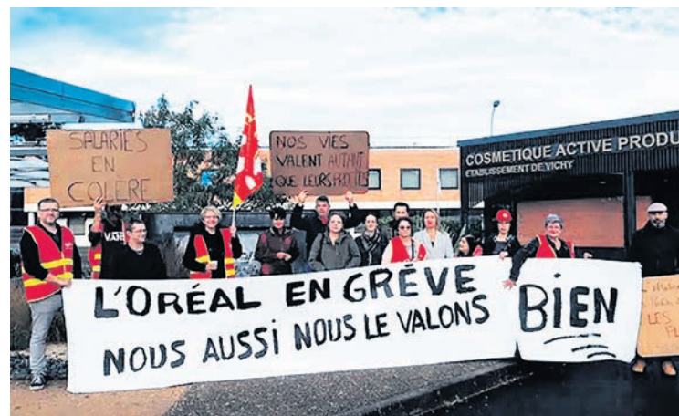
À Vichy, lors d'une précédente grève.