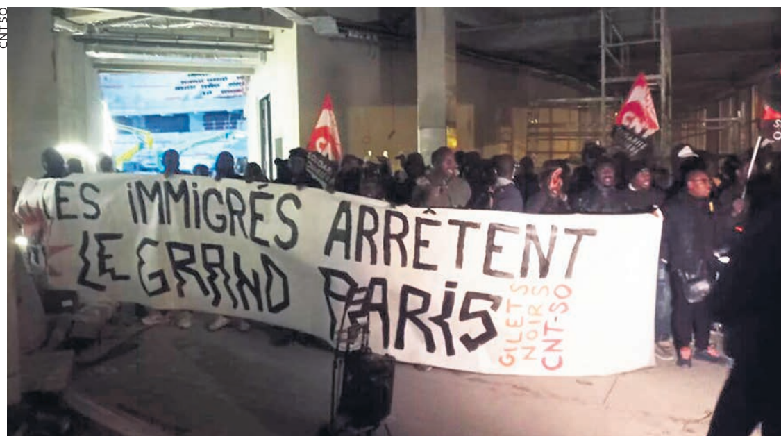
Sur le chantier Arena, Porte de la Chapelle.