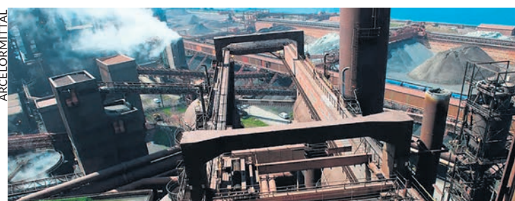
Un haut fourneau à Dunkerque.