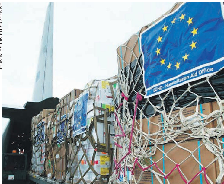
Aide humanitaire en provenance de l'Union européenne.