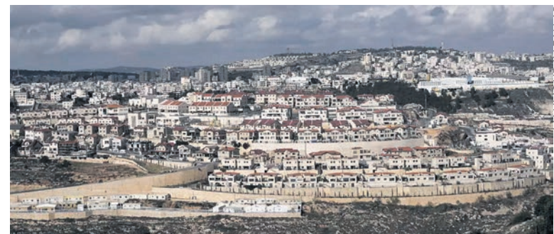
La colonie d'Efrat.

palestinienne depuis les accords d'Oslo de 1993-1995, la Cisjordanie est peuplée de