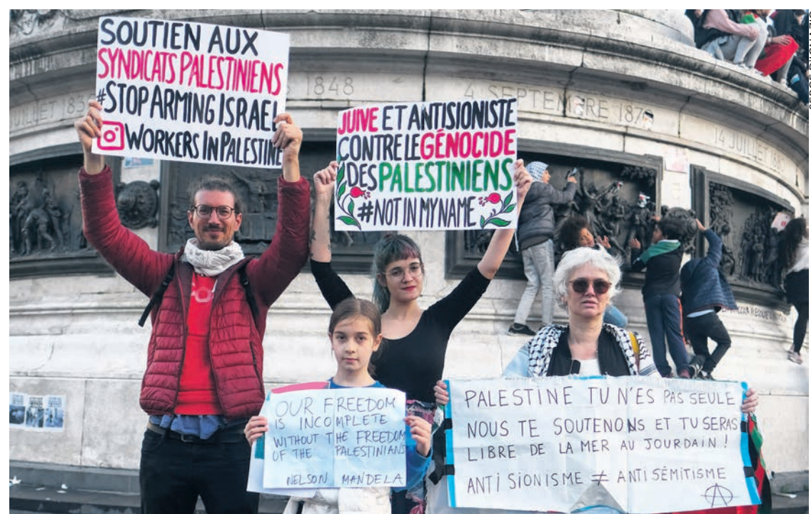
Dans la manifestation du 22 octobre à Paris.

Les tenants de l'ordre établi tentent aujourd'hui d'inverser les choses. Pourtant successeurs de générations d'antisémites patentés en France comme aux États-Unis et dans les autres pays impérialistes, ils affirment que la défense inconditionnelle d'Israël et la défense des Juifs en général contre l'antisémitisme se confondent. C'est un mensonge éhonté et surtout intéressé. En fait, ni le mouvement sioniste d'avant 1948, ni l'État d'Israël ensuite n'ont jamais regroupé ni représenté l'ensemble des Juifs, c'est-à-dire les cibles potentielles des antisémites. Il y a évidemment en Israël et dans tous les pays des voix juives qui s'élèvent contre le sionisme, contre la colonisation, contre le bombardement de Gaza, pour un État regroupant tous les peuples vivant sur la terre de Palestine et qui refusent de se sentir représentés par