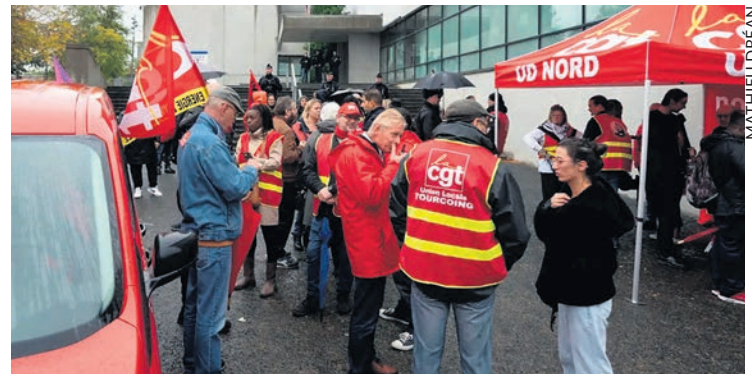
Devant le commissariat de Lille après l'arrestation du militant CGT.

Quant à ceux qui voulaient manifester leur soutien à la population palestinienne, Gérald Darmanin leur a répondu par une interdiction de manifester. Depuis, cette interdiction