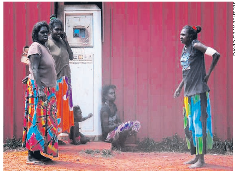
Membres de la communauté aborigène, près de Darwin.

Depuis, les gouvernements successifs ont multiplié les déclarations puis, en